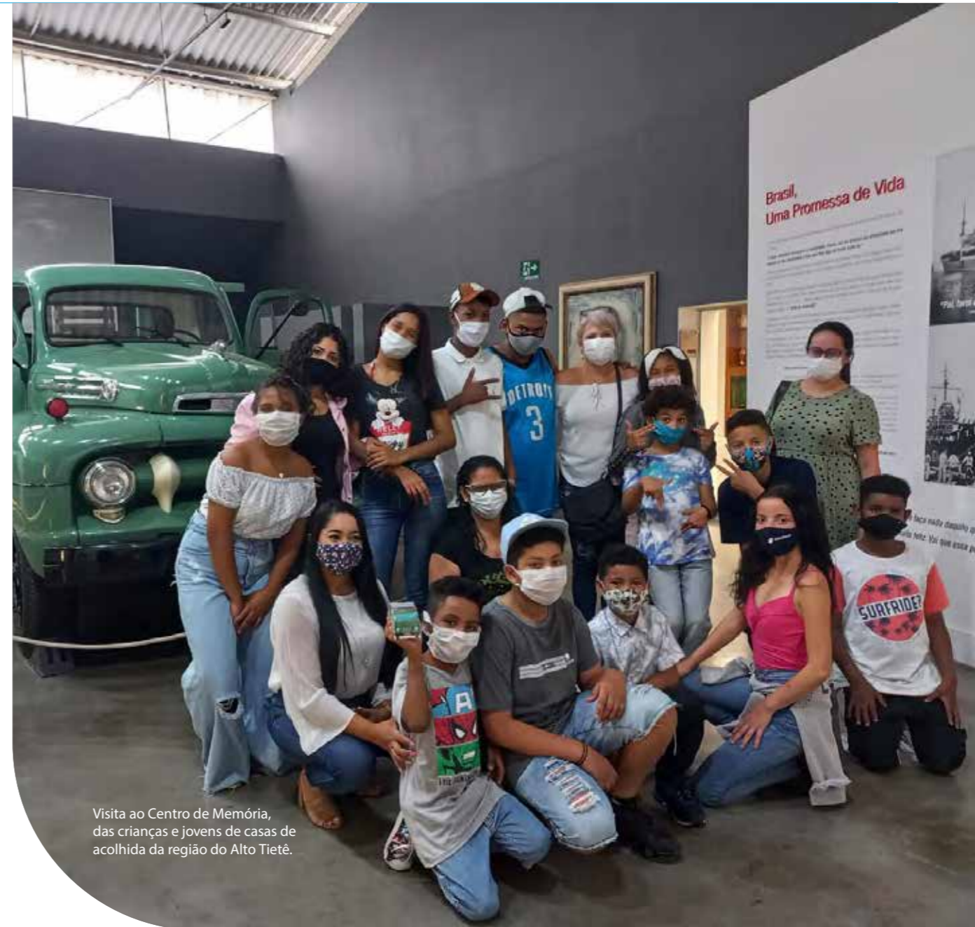
Visita ao Centro de Memória, das crianças e jovens de casas de acolhida da região do Alto Tietê.

Os investimentos em planos de atuação social da SIMPAR e suas controladas contam com um forte aliado para a concretização de ações de impacto nas comunidades: o mapeamento socioeconômico de municípios realizado em 2020 e atualizado em 2021, sob a coordenação do Comitê de Sustentabilidade.